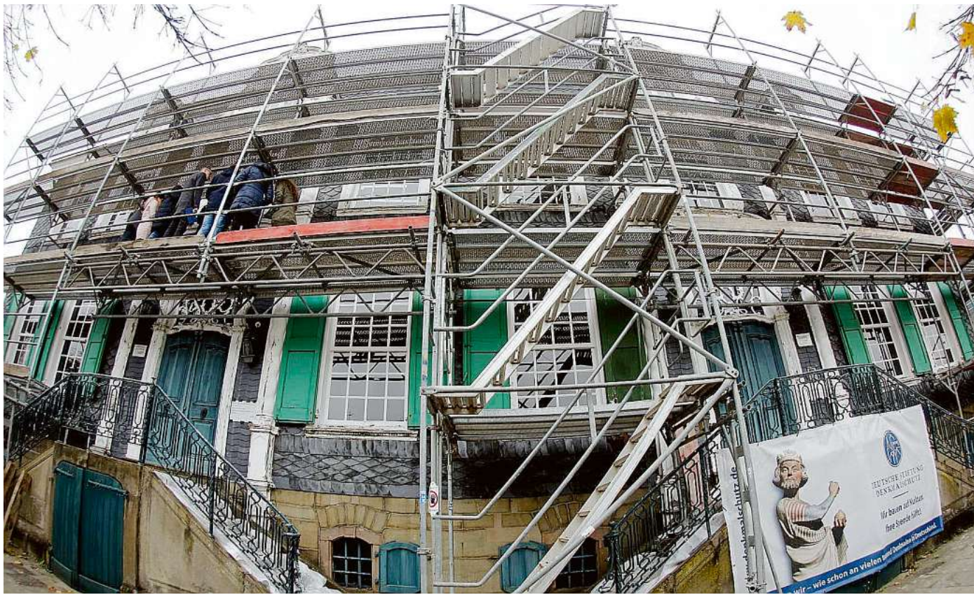
Am Hasten nicht zu übersehen: Am Haus Cleff haben die 3,5 Millionen Euro teuren Sanierungsarbeiten begonnen.

Nach jahrelanger Planung ist die Sanierung des 241 Jahre alten Haus Cleff jetzt gestartet – und jeder, der über die Hastener Straße fährt, kann das sehen. Das Gerüst steht, Planen bedecken die Treppenaufgänge, hier und da sind Schieferplatten demontiert worden. 3,5 Millionen Euro stehen für die Verjüngungskur zur Verfügung – allein 490 000 Euro davon kommen aus dem Denkmalschutzprogramm des Bundes, 120 000 Euro von der Stiftung Deutsche Denkmalpflege, den Rest schultert die Stadt. In den nächsten zwei bis zweieinhalb Jahren gilt es vor allem darum, Schiefer, Gauben und das Dach zu erneuern – nach den strengen Maßgaben der Denkmalbehörde. red